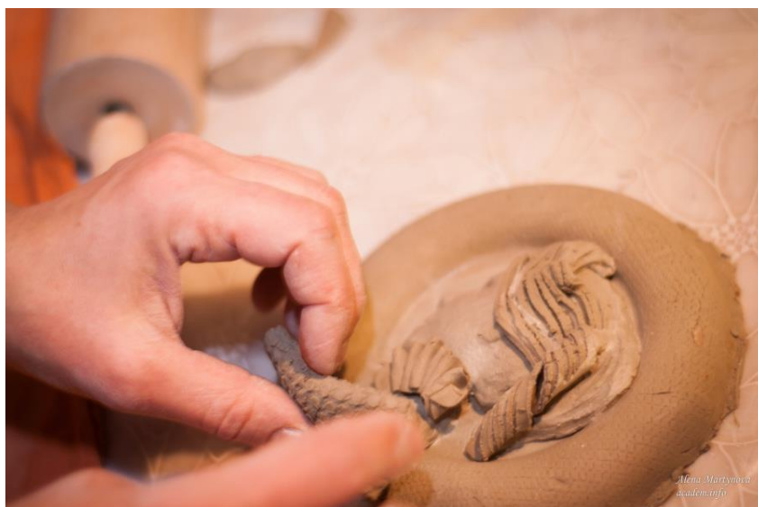
Рис. 7. Работа с глиной