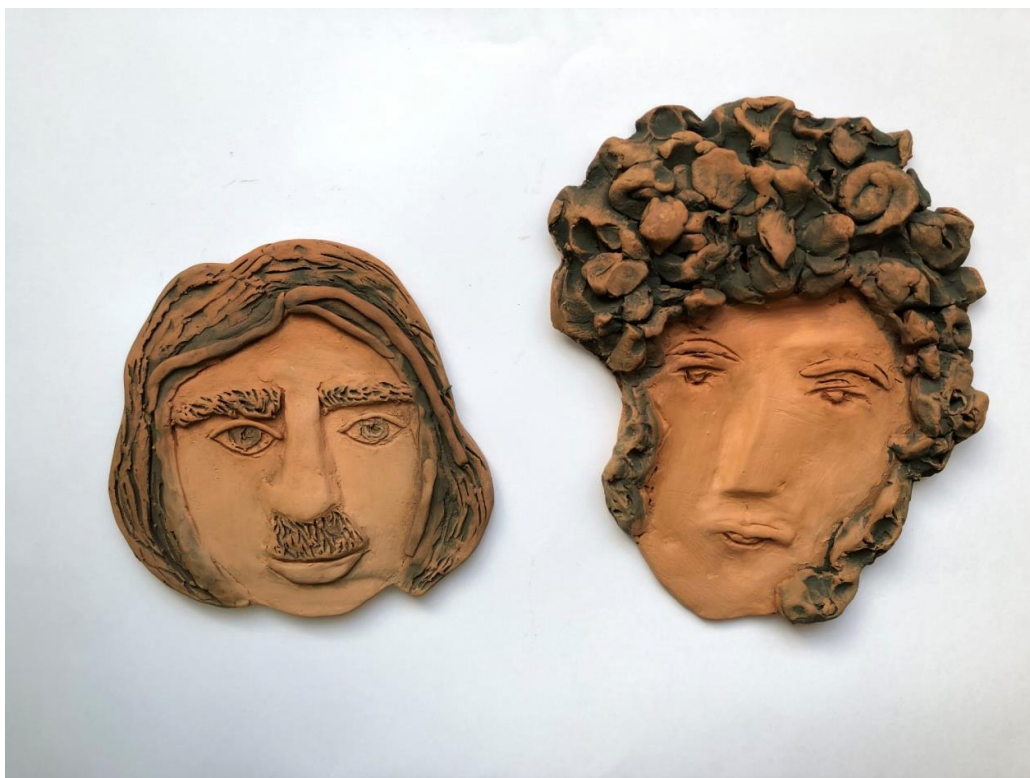
Рис. 8. Готовые работы учащихся