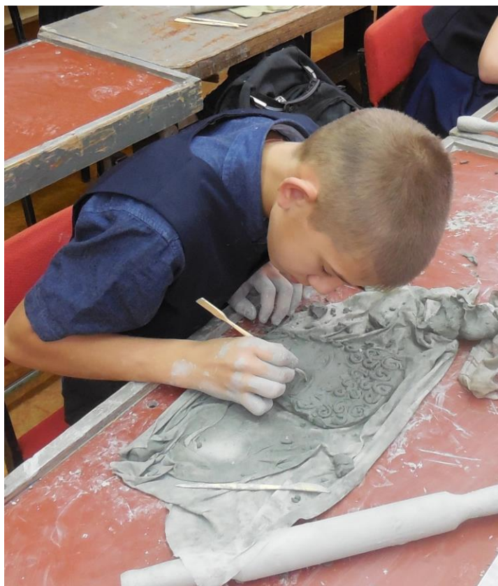
Рис. 5. Учащийся за работой в мастерской