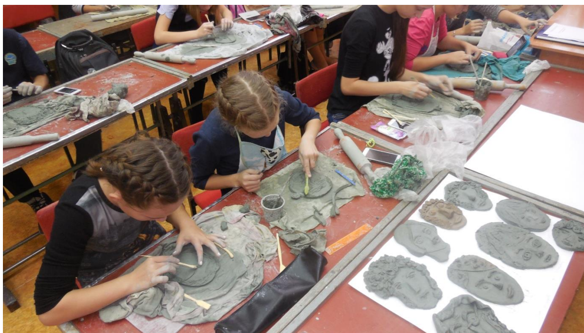
Рис. 6. Учащиеся за работой в мастерской