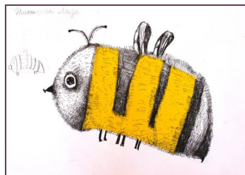
Рис. 1 б Шипицина Елизавета, «Шумит шуршащий шмель»

На основе педагогического опыта преподавателей школы, было замечено, что раннее знакомство со стилизацией дает более значимый и положительный результат развития абстрактного и образного мышления у обучающихся. Учащиеся, освоившие стилизацию в раннем возрасте, более творчески, оригинальнее, с большим пониманием, поставленных задач, подходят к выполнению задания на уроках дизайна в старших классах.