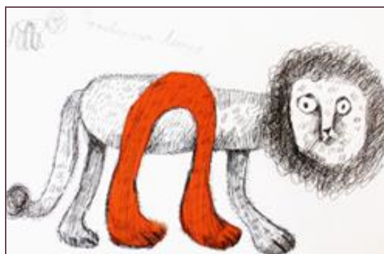
Рис 1а Панаско Леонид «Ленивый лев – Лёня»

Задание начинается с выполнения эскизов простым карандашом в левом верхнем углу листа ватмана (формат А3). Затем учащиеся вырезают силуэт буквы из цветной бумаги, komponуют и наклеивают её на лист. Образ животного дорисовывается гелевой ручкой, форма животного стилизуется под букву. Создание художественного образа буквы-животного дополняется авторским названием, например: «Ленивый лев - Лёня» (Рис. 1а), «Шумит шуршащий шмель» (Рис. 1 б). Взятая за основу буква, дублируется и в названии, это обогащает придуманный образ, делает его завершённым.